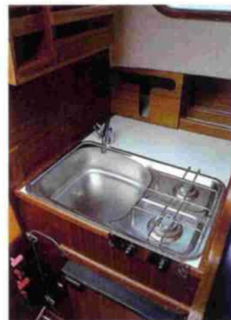
Las reducidas dimensiones de la cocina se han aprovechado bien. El espacio para trabajar deberá crearse mediante una tapa que cubra el fregadero. Bajo el mismo está la nevera de 12 V.