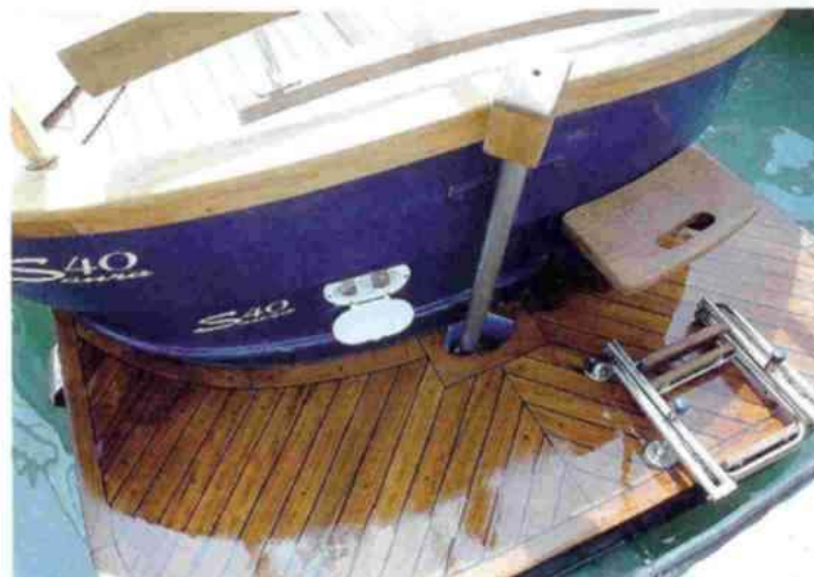
La plataforma de baño es de grandes dimensiones. Posee una ducha con agua caliente opcional y un necesario peldaño para acceder a ella.

al pozo de la cadena. Como manda la tradición, posee dos bitas de madera en cada amura en vez de las clásicas cornamusas metálicas. En esta zona se encuentra el palo que, en este caso, soporta el travesaño que hace de soporte al toldo enrollable que discurre por él. Inmediatamente se alza la superestructura en la que se puede tomar el sol cómodamente al instalarse las colchonetas. El astillero ha aprovechado el reverso de la tapa que protege el acceso al interior para hacer una enorme compartimentación, en la que se dispone de sujetav vasos y algunos huecos para colocar objetos personales mientras se toma el sol.