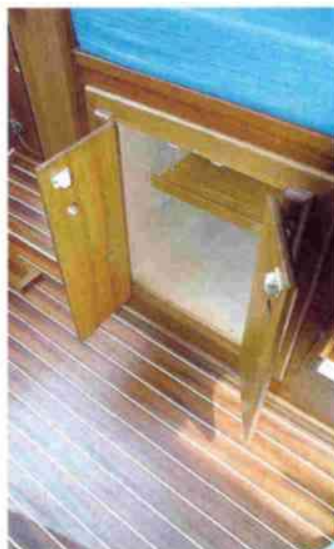
El armario bajo uno de los asientos del salón es el espacio de estiba natural de alimento y menaje de la cocina.

En su característica popa redonda se ha integrado una plataforma de baño, a la cual se accede con comodidad gracias al gran peldaño saliente. La plataforma está dotada de una escalerilla de baño que se pliega encima de la misma y de una ducha que opcionalmente puede ser de agua caliente.