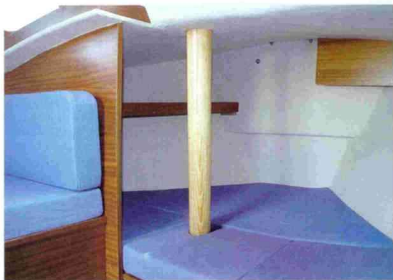
La litera de proa sería más cómoda sin el palo pasante. Al fondo se halla un estante para pequeños objetos.