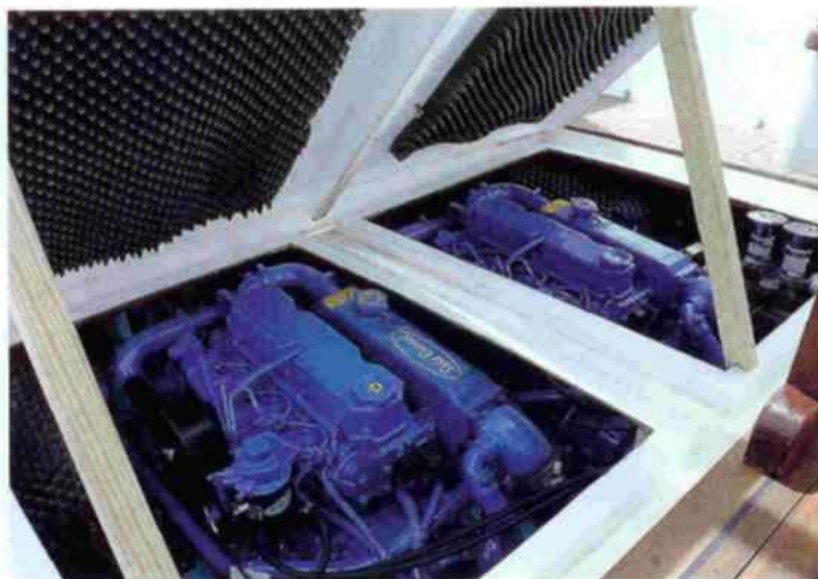
Frente a la entrada a la cabina se encuentran los dos tambuchos de acceso a los dos motores Solé Mini 62 con los que estaba dotada la unidad probada. El soporte de los mismos se realiza de forma sencilla.