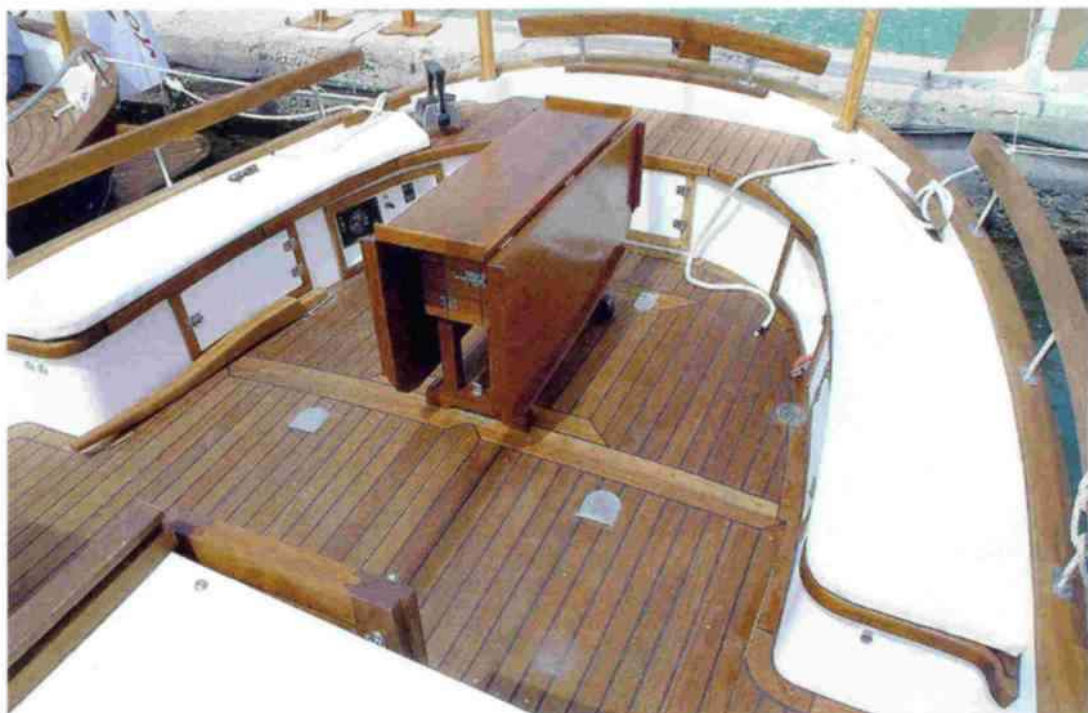
La bañera es especialmente amplia y confortable, con una mesa de doble ala que puede retirarse.

La Saura 40 tiene el equipo de fondeo necesario para fondear en las calas, que está dotado de un molinete de 1.000 W que tira de la cadena a través del botolón que sirve, además, de ayuda en el desembarco por proa hacia el pantalán. A banda y banda del mismo se puede acceder