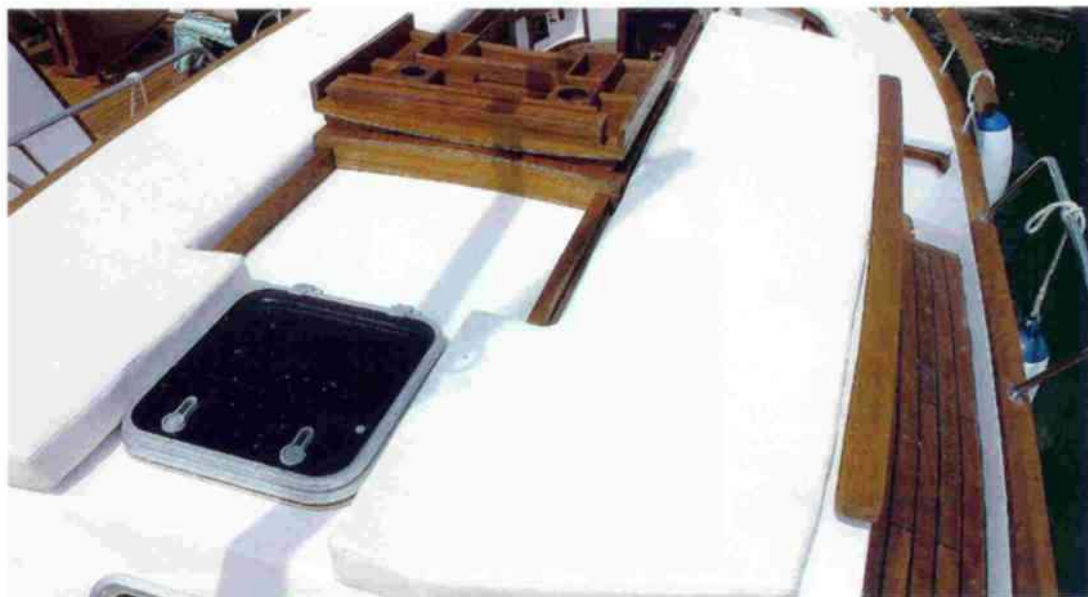
La sobreestructura es el espacio natural para tomar baños de sol. Las colchonetas quedan encajadas entre el rail de la tapa protectora de la entrada y el pasamanos.