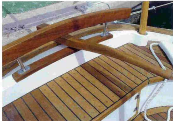
La acción de la barra del timón queda limitada por la presencia de los soportes del espaldero del timonel.