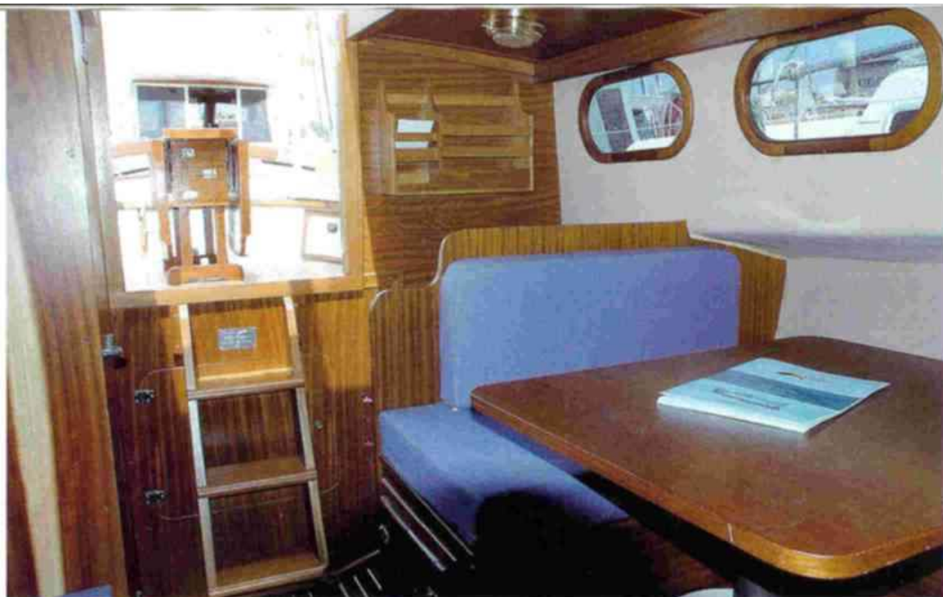
Bajo la escalerilla de entrada se encuentra la puerta que da a la cámara de los motores.

alrededor de la mesa. A banda y banda de la bañera discurren los clásicos bancos de este tipo de embarcación, muy amplios, para poder tomar también aquí el sol. Unos robustos y curvos espalderos realizados en madera ofrecen una comodidad añadida al sentarnos. Bajo los bancos se