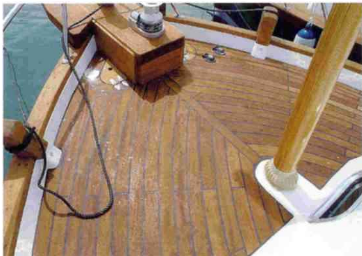
Dos bitas tradicionales sirven para amarrar. La cubierta está forrada por lamas de teca de gran grosor.